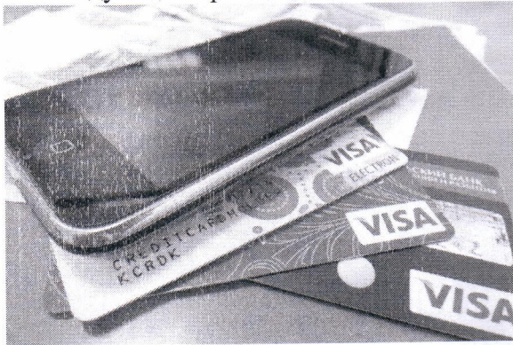
Схема такая: мошенники, представляясь сотрудниками служб безопасности банков или «единой организацией по защите от банковских преступлений», под видом отмены незаконных операций выманивают у жертв данные банковских карт, а после снимают с них деньги. При этом мошенники могут даже представиться или назвать регалии «сотрудников», но верить им не стоит: их цель — незаконное получение секретных персональных данных клиента (паролей,

Массовые кражи с банковских карт. Преступный мир чутко реагирует на новые возможности незаконного обогащения, которые обусловлены прогрессивными технологиями в сфере компьютеризации. Всплеск случаев телефонного мошенничества с последующей кражей денег с банковских карт жертв зафиксирован в целом по стране.